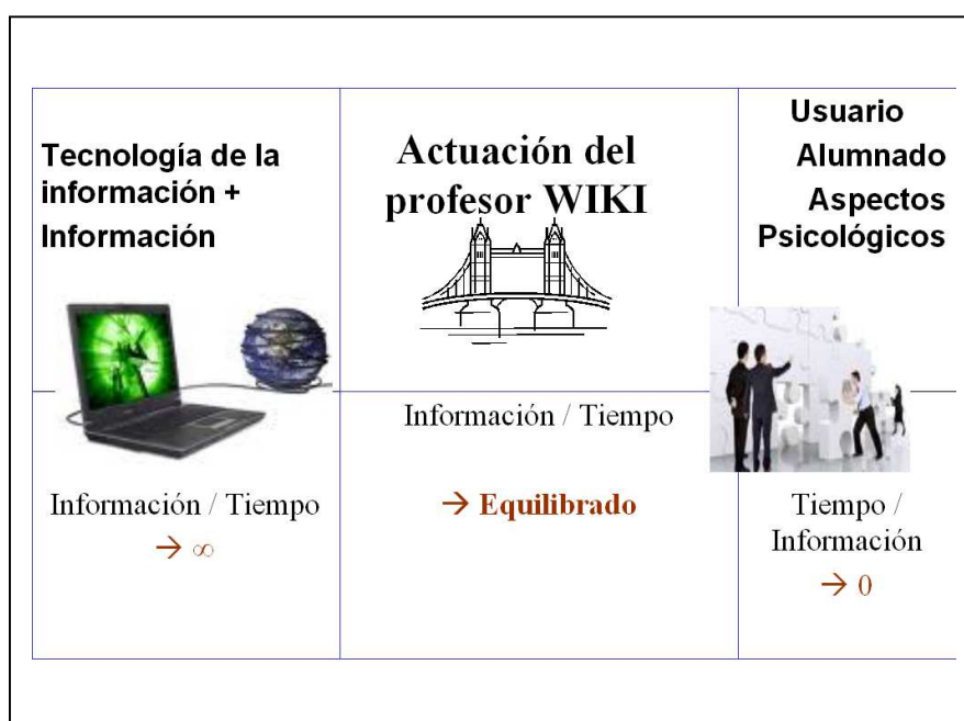
Figura 3: El profesor con el contenido en una WIKI modera los contenidos.

Por lo tanto, el dilema que aparece es la figura 3.